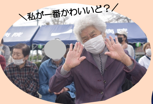
／私が一番かわいいど？／