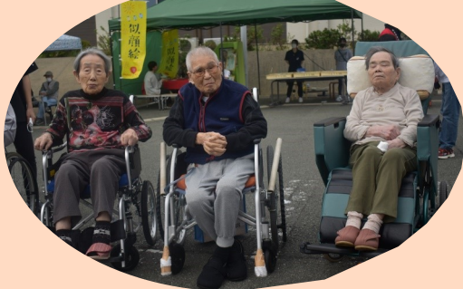
／たくさん食べたよ〜／