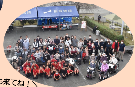
／また来年も来てね！／