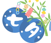
職員手作りの彦星&織姫のパネル♪